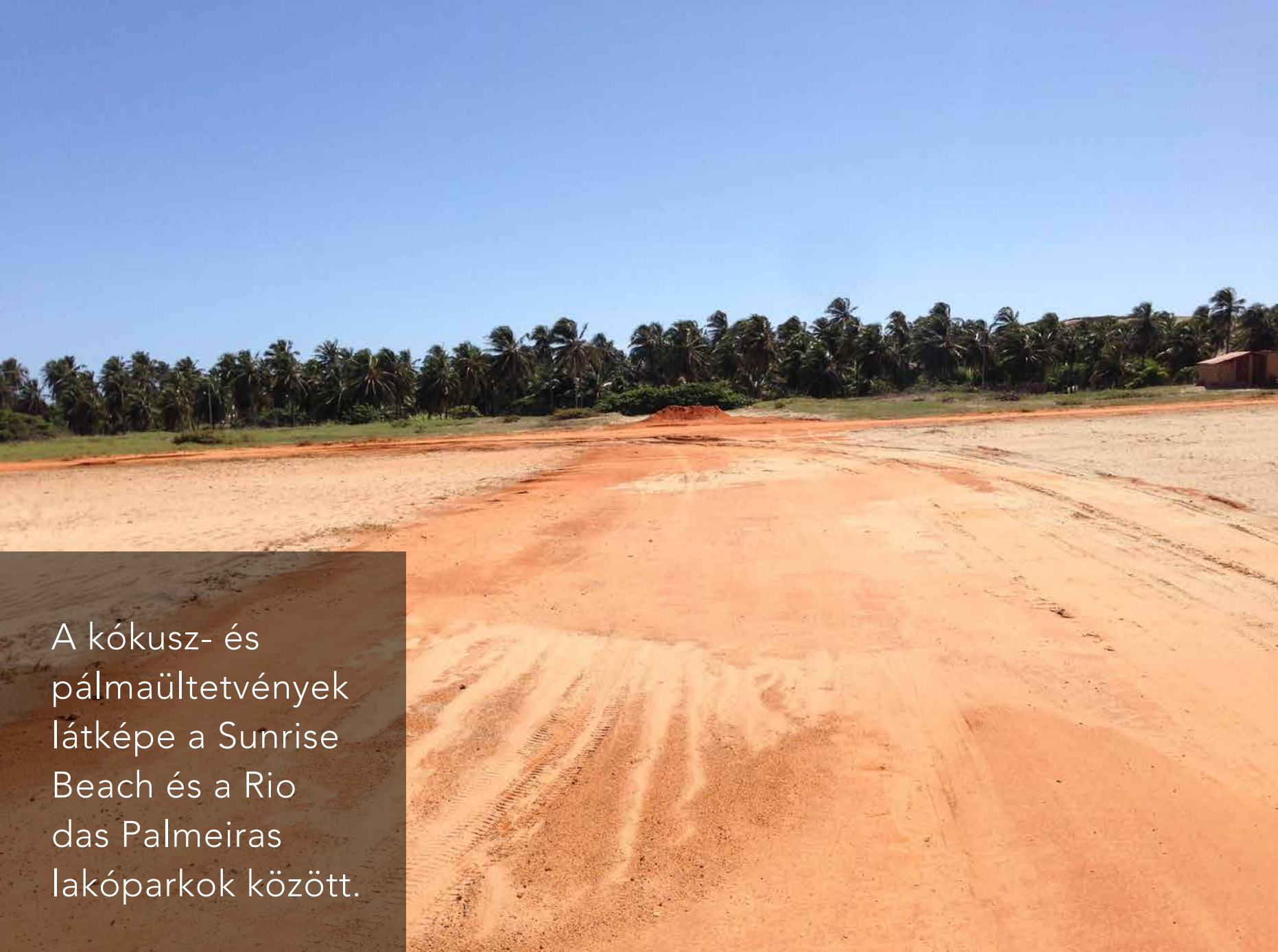
A kókusz- és pálmaültetvények látképe a Sunrise Beach és a Rio das Palmeiras lakóparkok között.