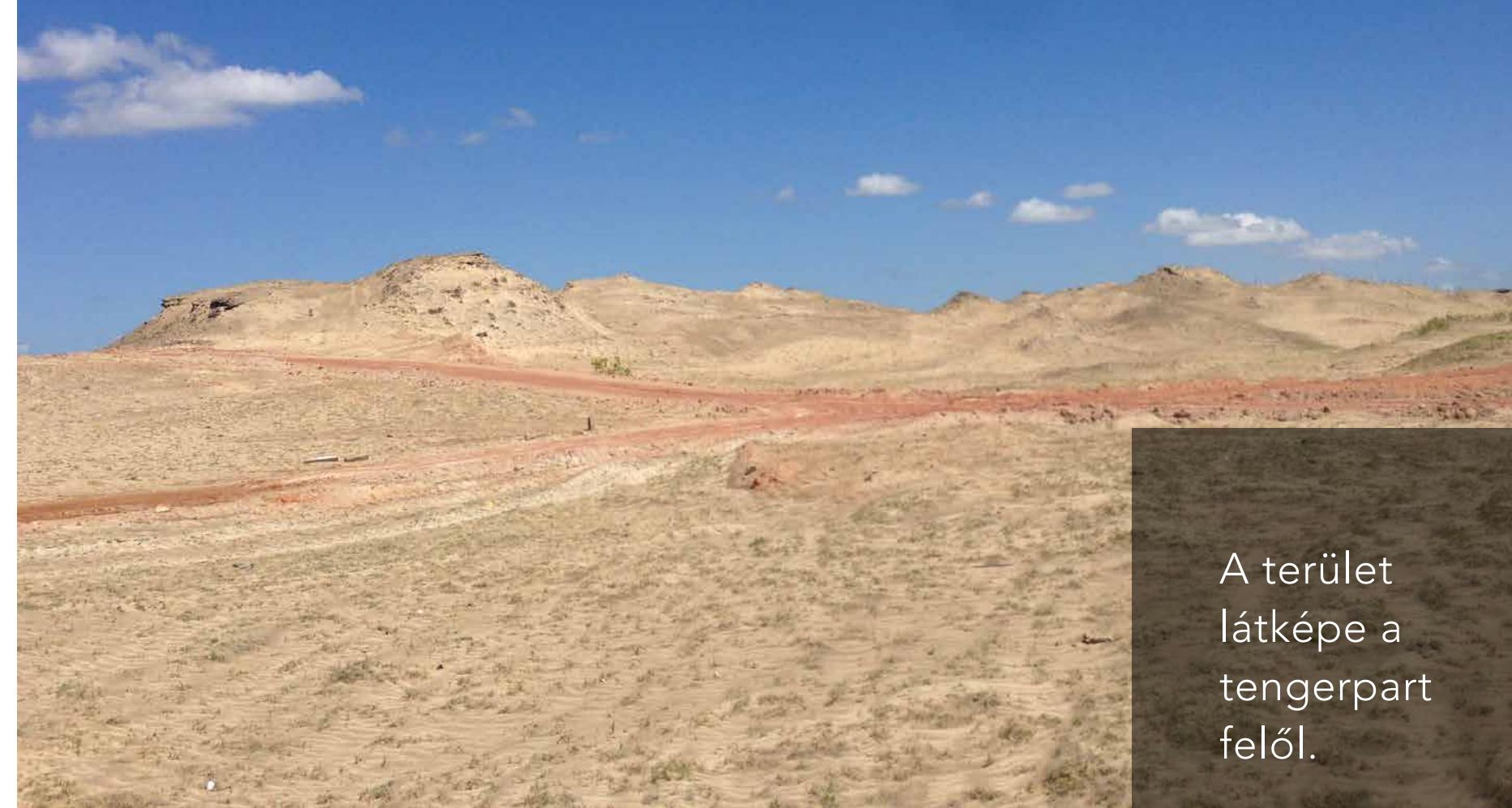
A terület látképe a tengerpart felől.