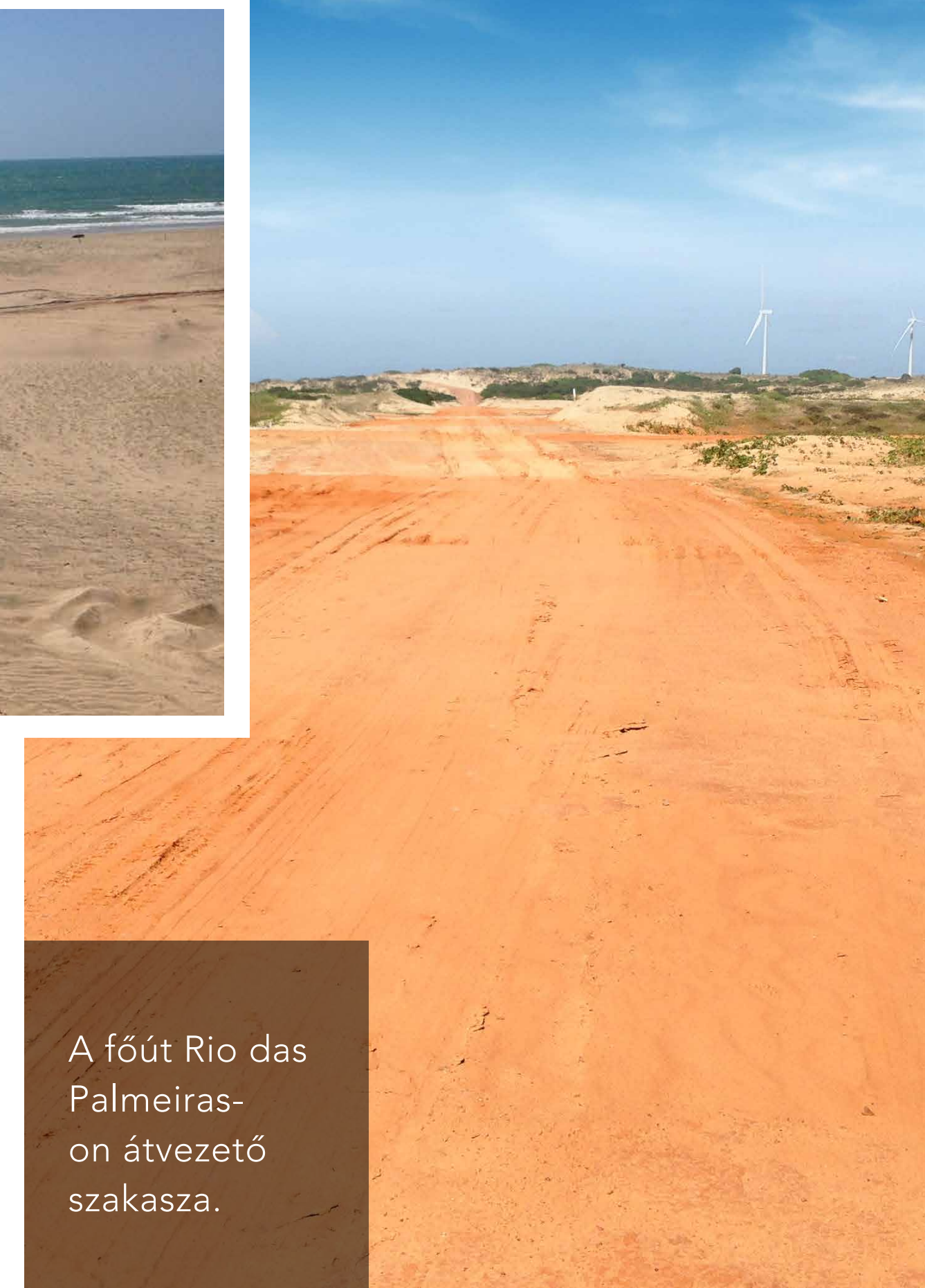
A főút Rio das Palmeiras-on átvezető szakasza.