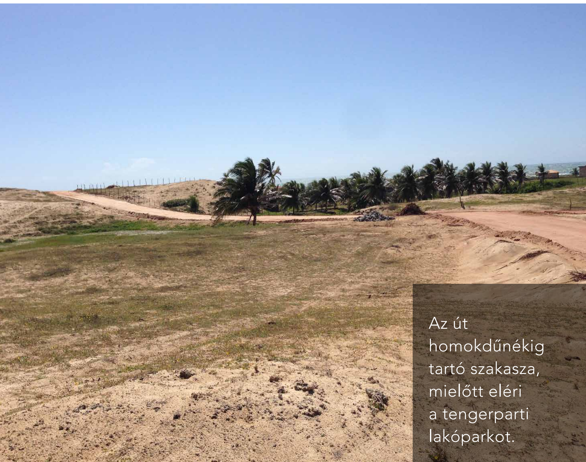
Az út homokdűnéig tartó szakasza, mielőtt eléri a tengerparti lakóparkot.