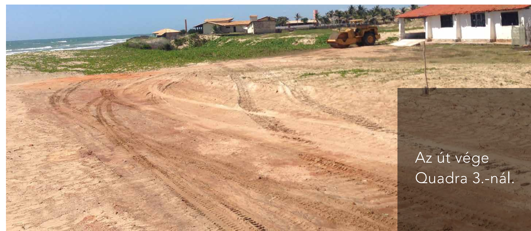
Az út vége Quadra 3.-nál.