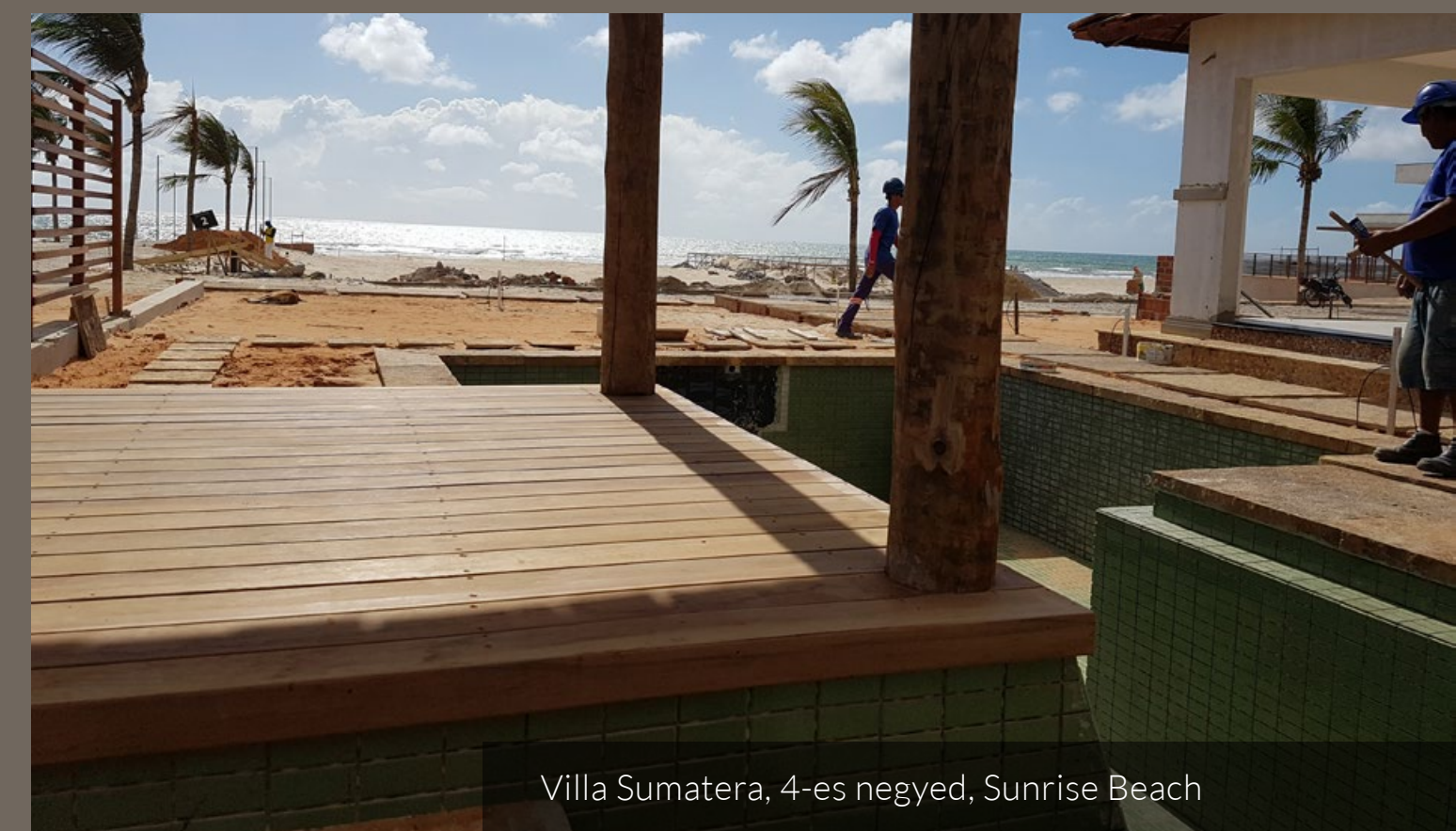
Villa Sumatera, 4-es negyed, Sunrise Beach