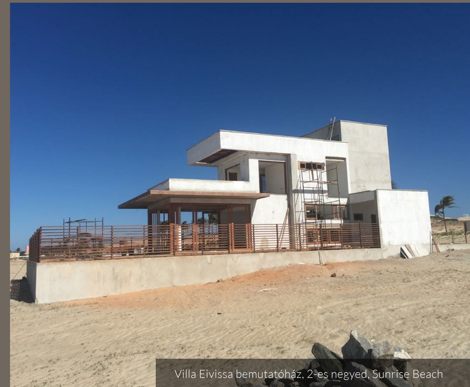
Villa Eivissa bemutatóház, 2-es negyed, Sunrise Beach

Ennek kidolgozása még jelenleg is tart, a következő hírlevélben már reméljük, hogy több részlettel tudunk szolgálni.