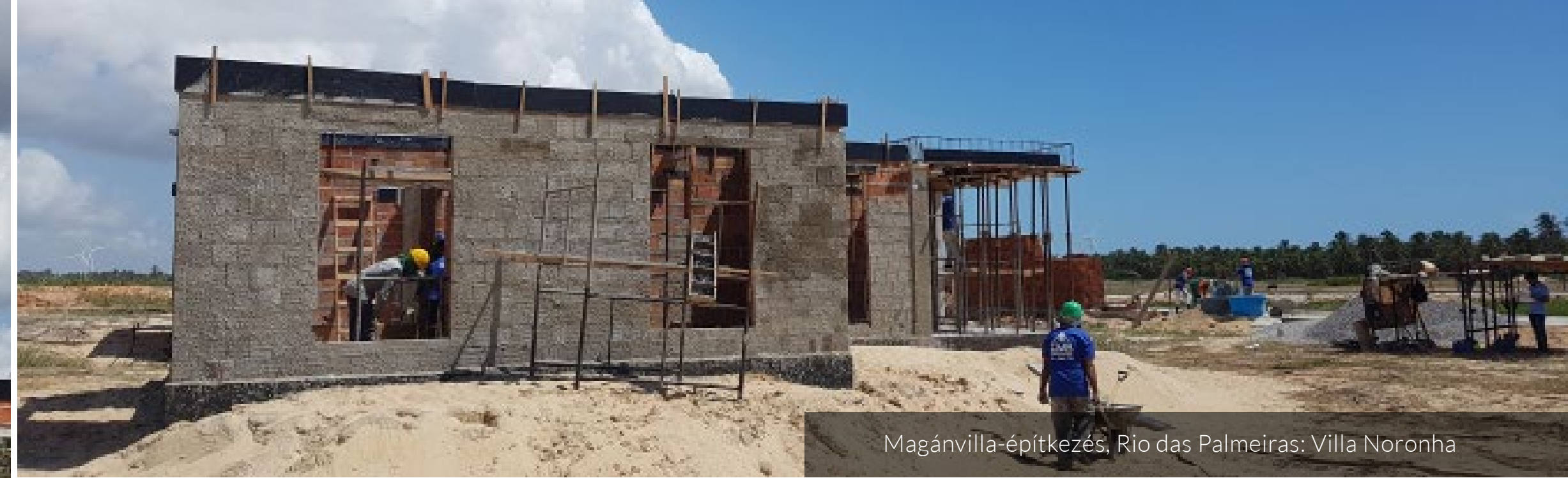
Magánvilla-építkezés, Rio das Palmeiras: Villa Noronha