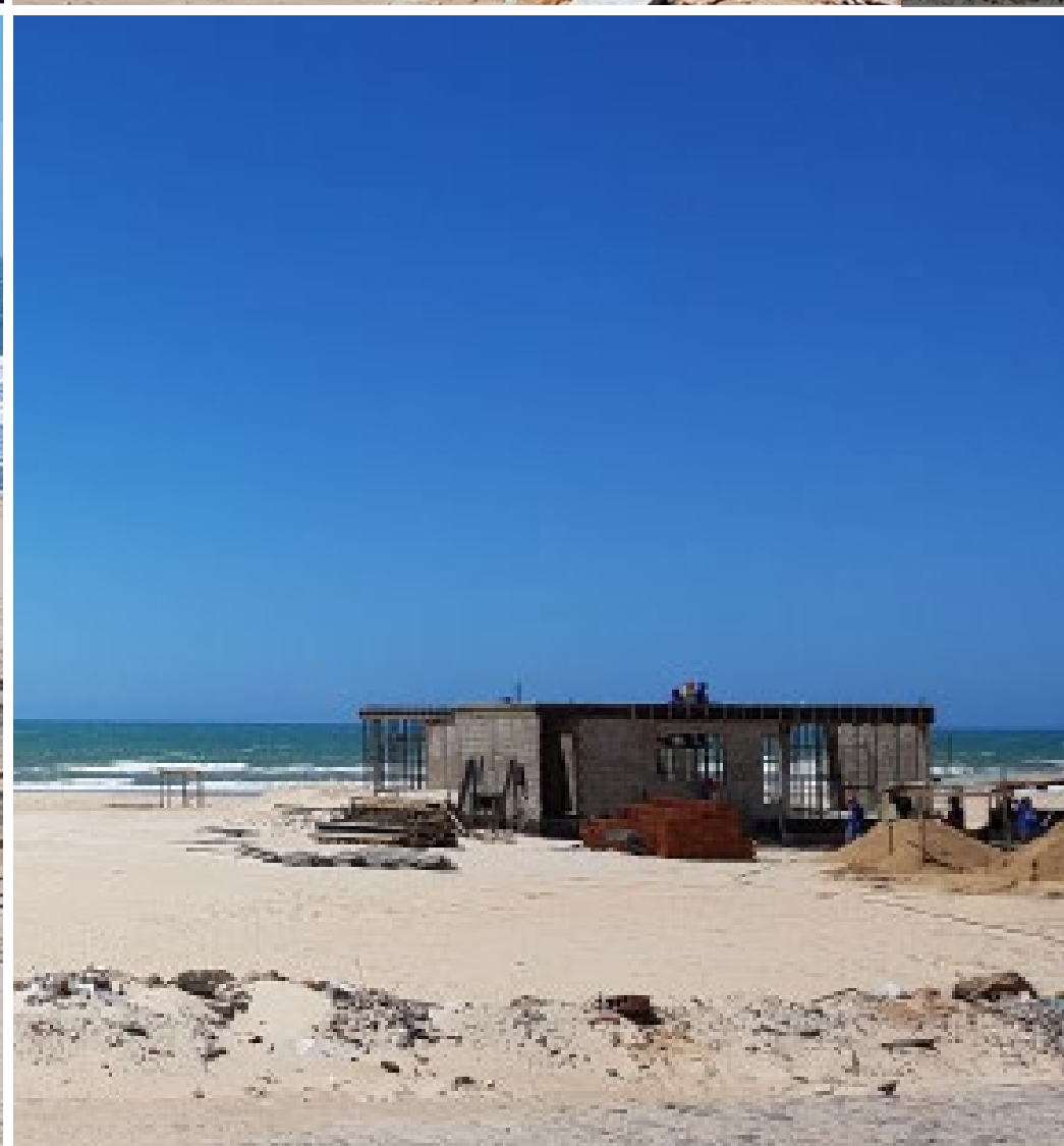
Magánvilla-építkezés, Sunrise Beach: Villa Eivissa