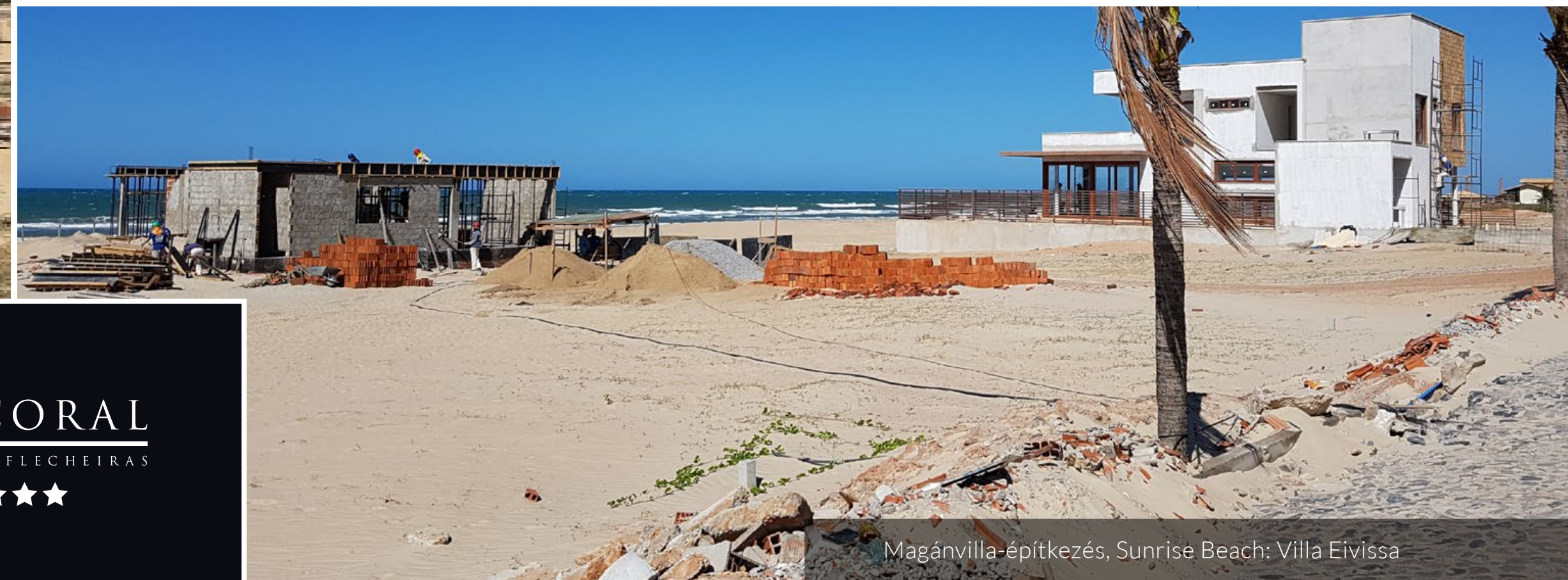
Magánvilla-építkezés, Sunrise Beach: Villa Eivissa