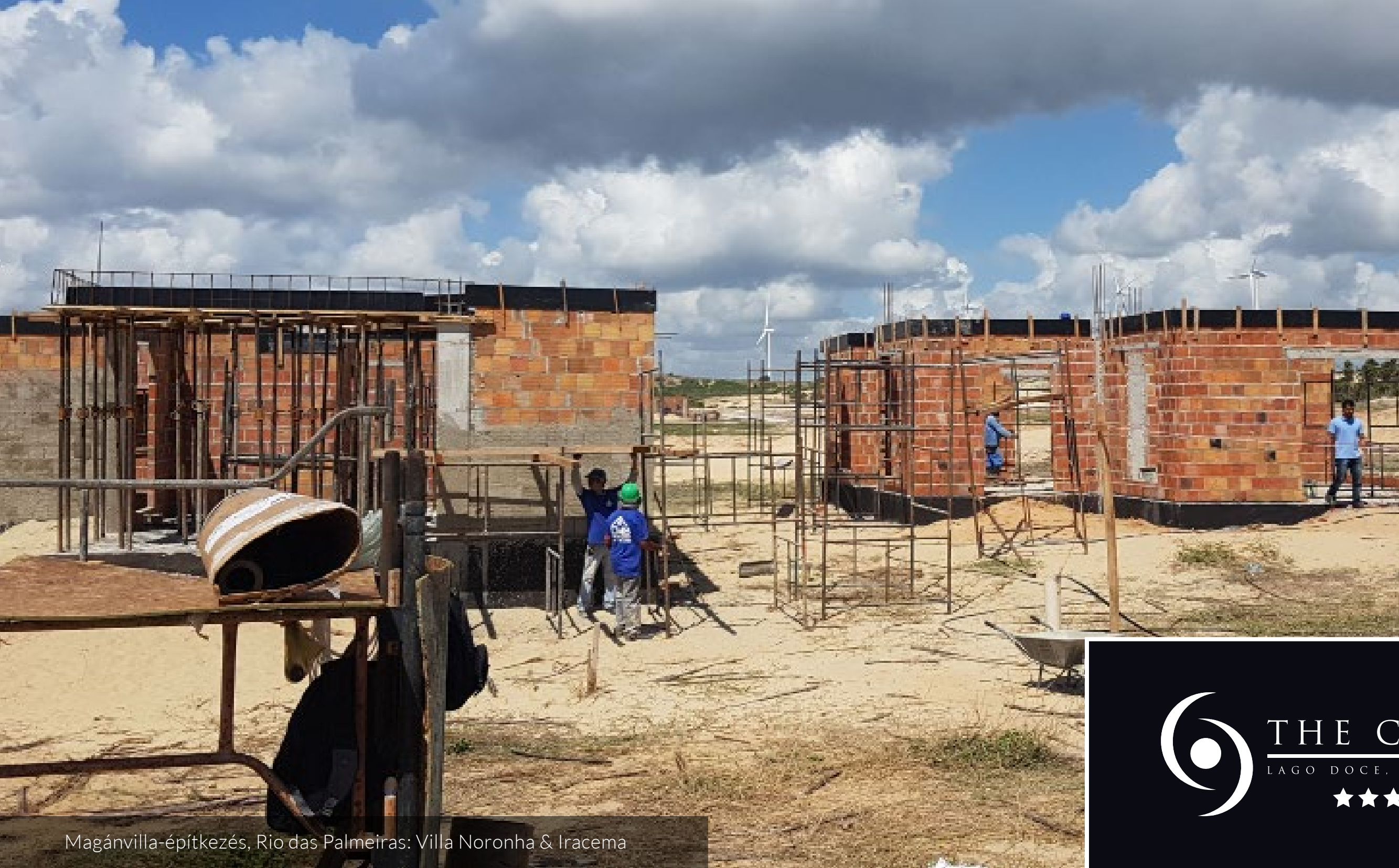
Magánvilla-építkezés, Rio das Palmeiras: Villa Noronha & Iracema