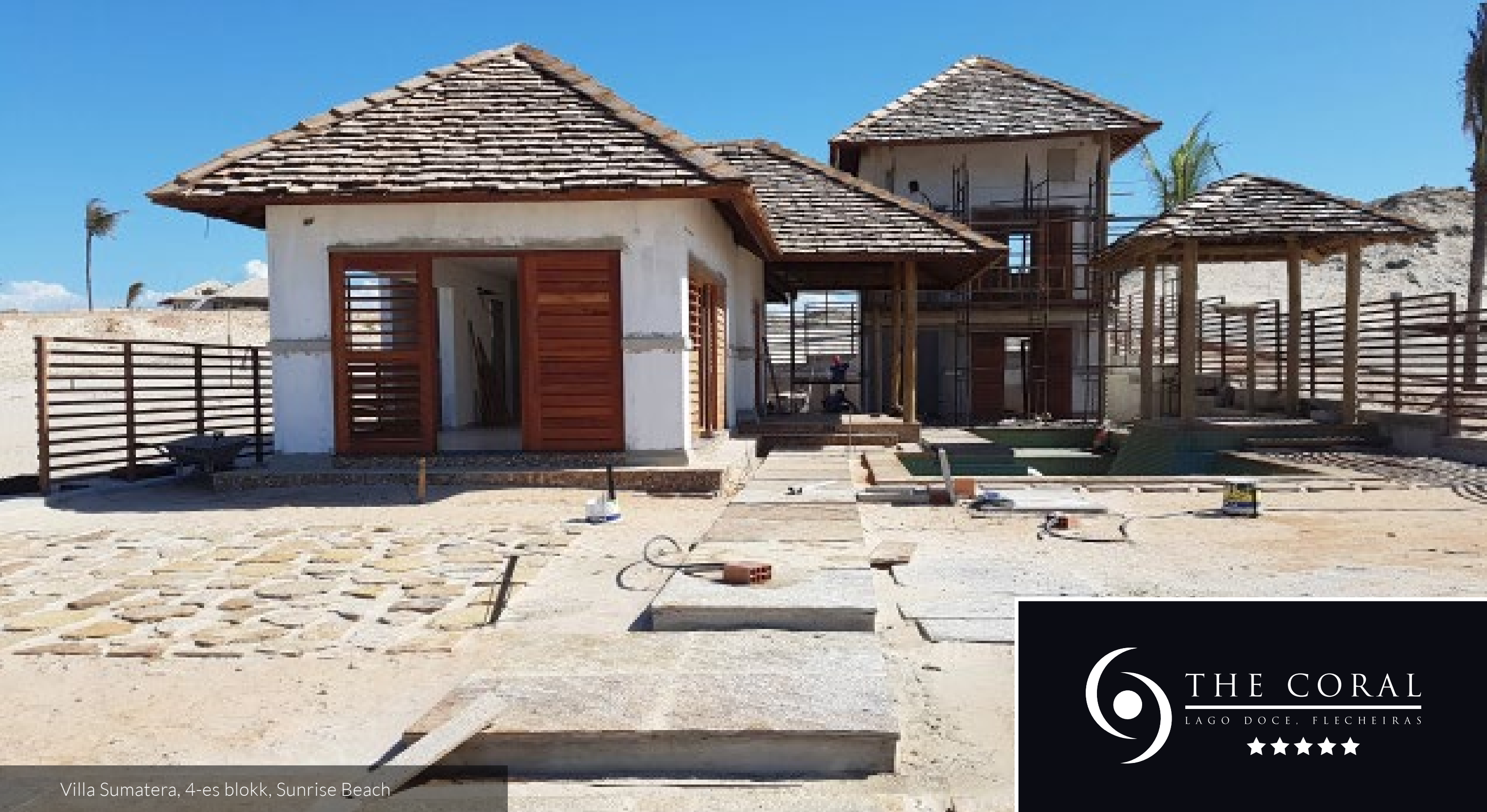
Villa Sumatera, 4-es blokk, Sunrise Beach