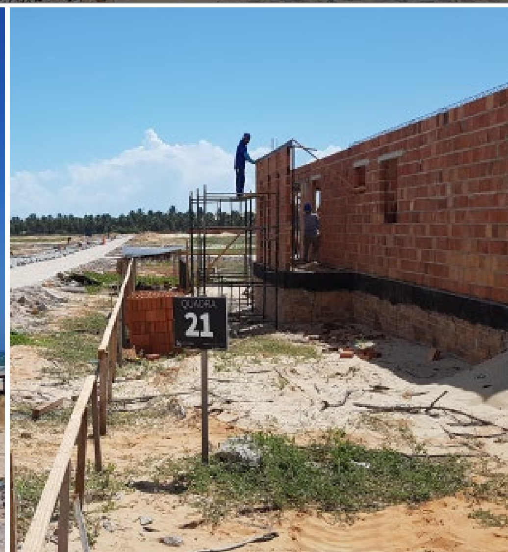
Magánvilla-építkezés, Lago Doce: Villa Nusa Dua