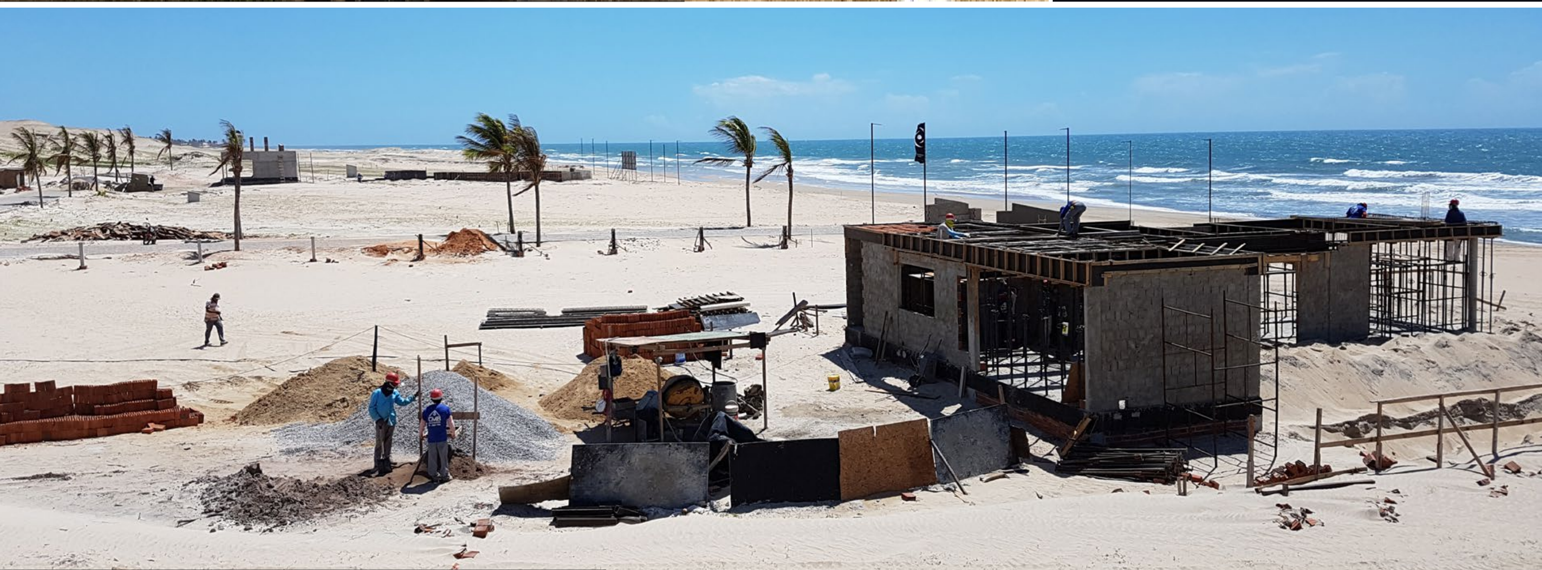
Magánvilla-építkezés, Sunrise Beach: Villa Eivissa