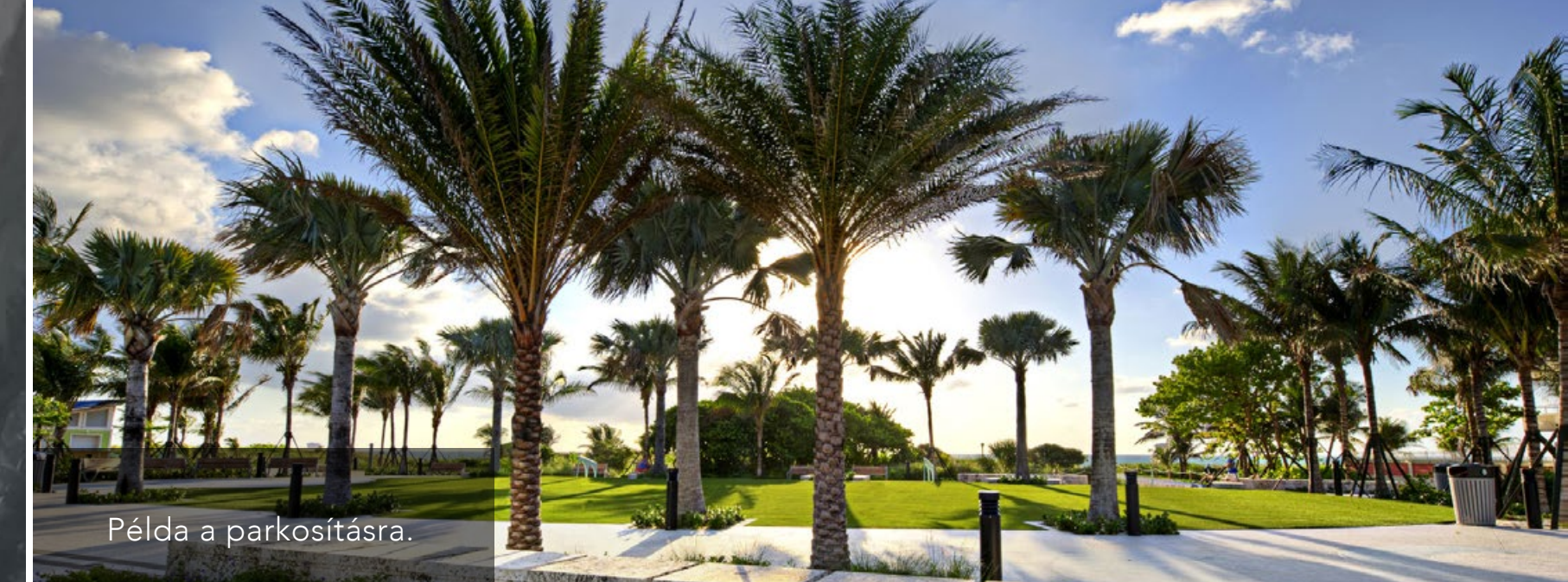
Példa a parkosításra.