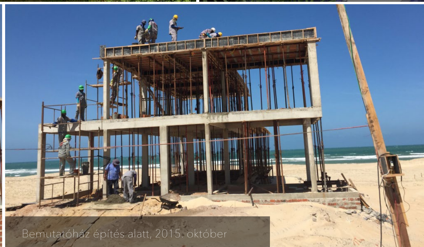
Bemutatóház építés alatt, 2015. október