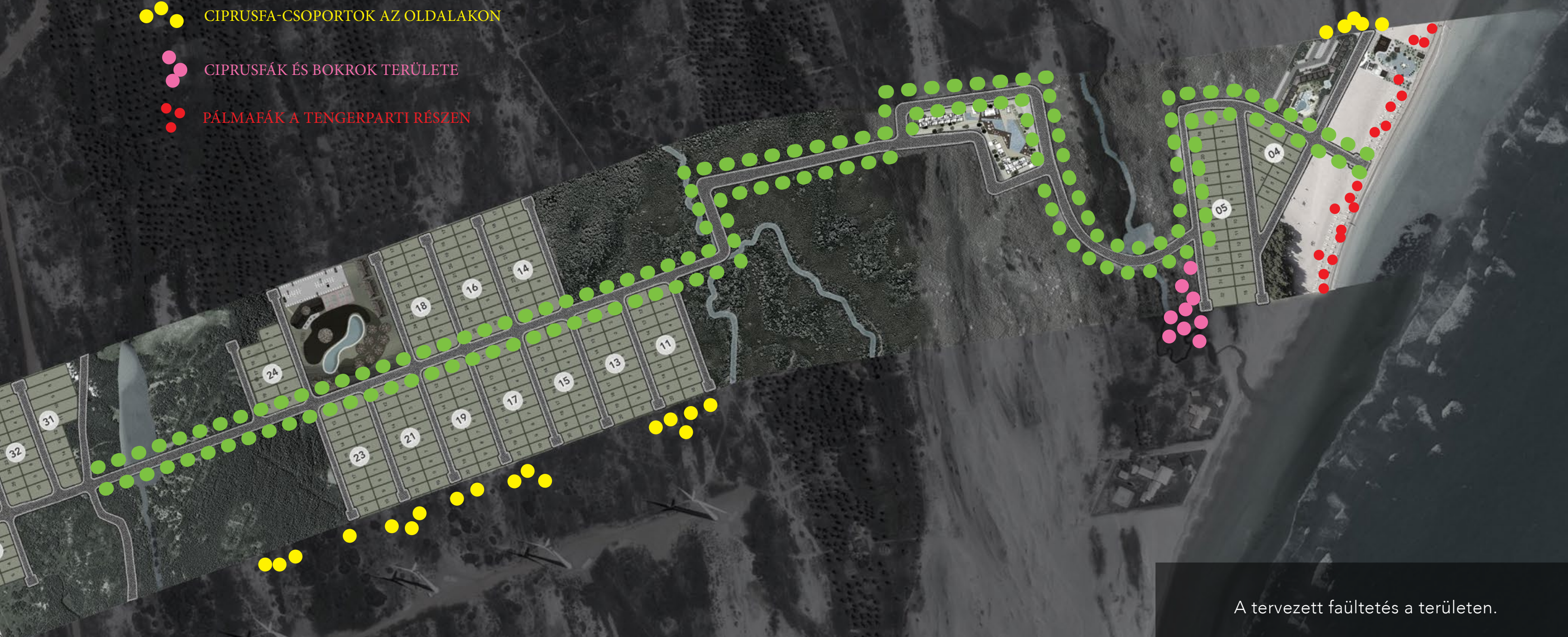
A tervezett faültetés a területen.