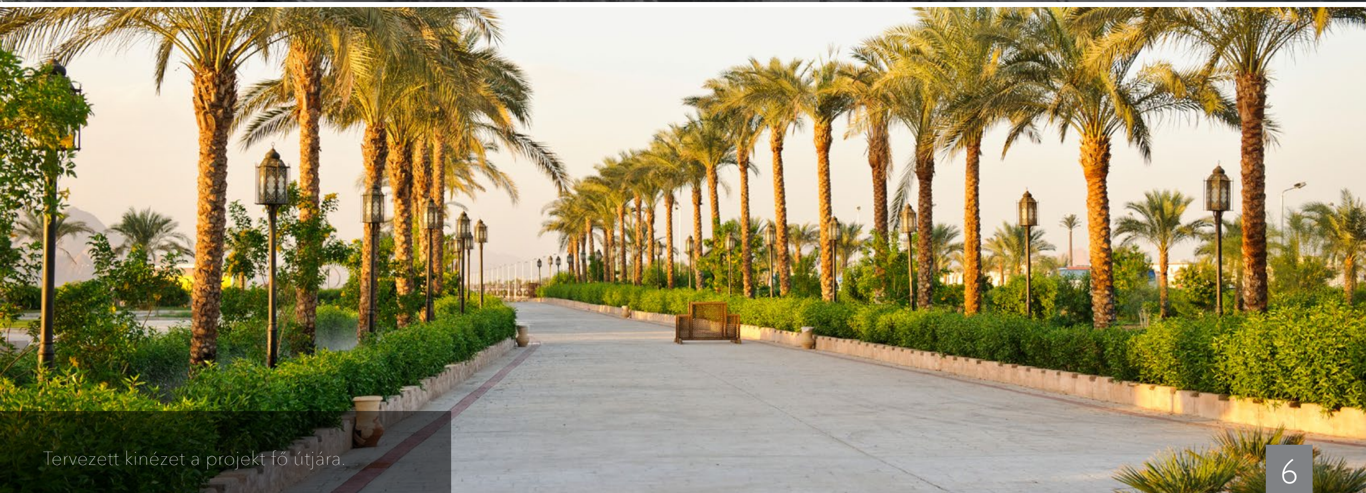
Tervezett kinézet a projekt fő útjára.