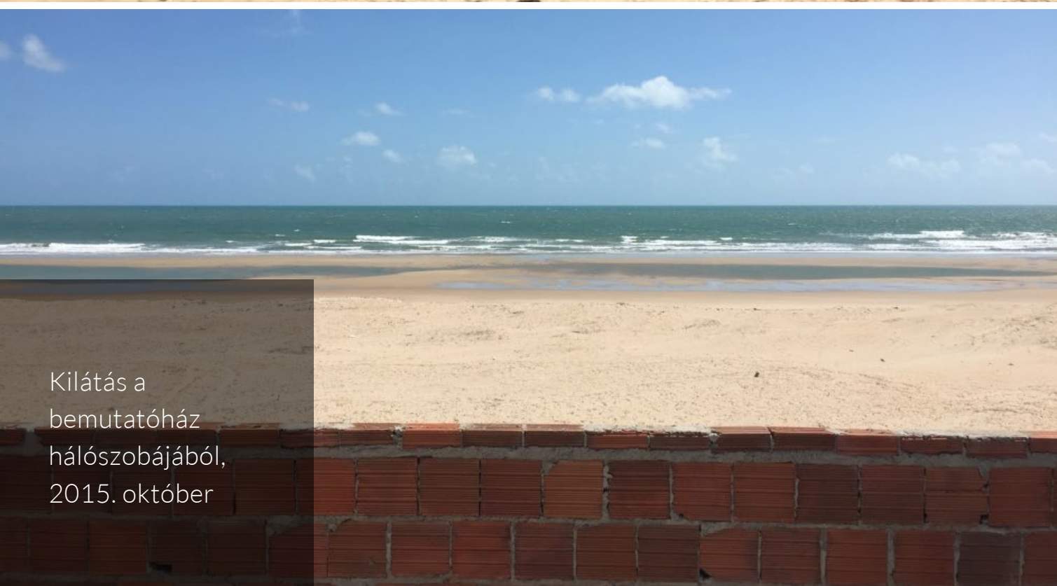
Kilátás a bemutatóház hálószobájából, 2015. október