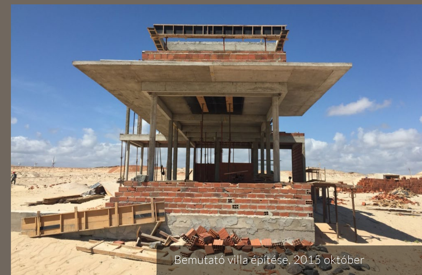
Bemutató villa építése, 2015 október