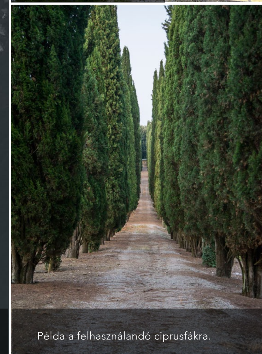
Példa a felhasználandó ciprusfákra.