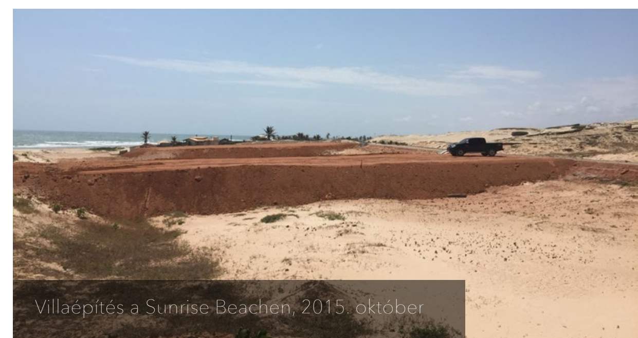
Villaépítés a Sunrise Beachen, 2015. október