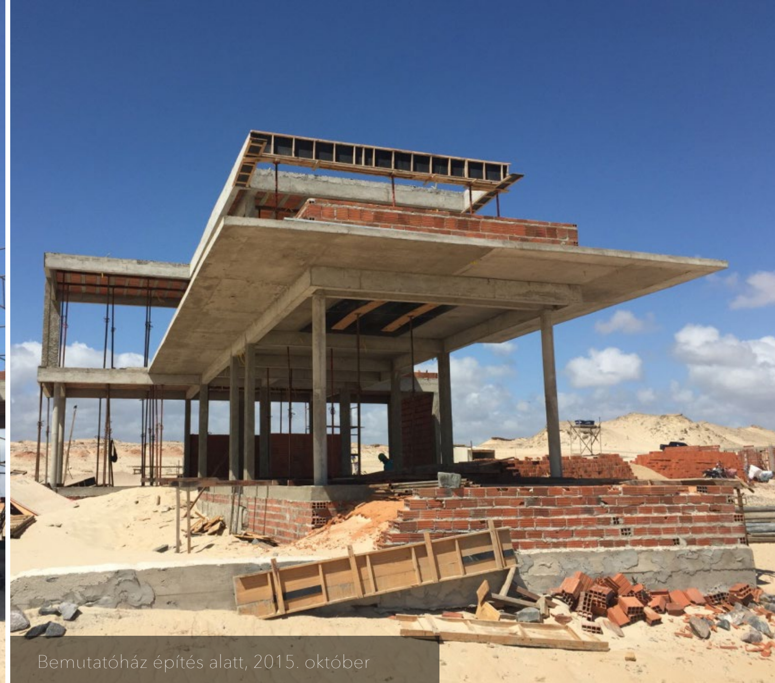
Bemutatóház építés alatt, 2015. október