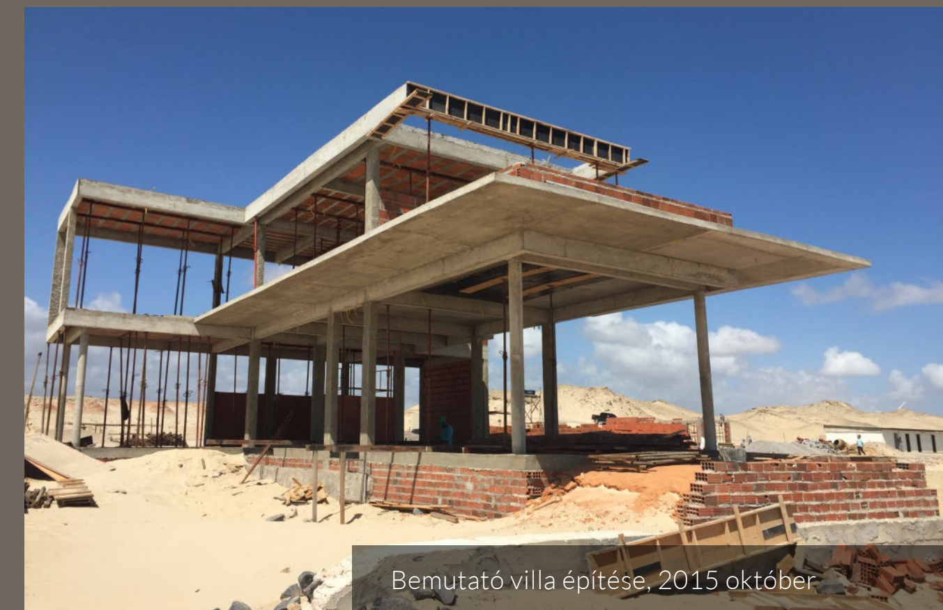
Bemutató villa építése, 2015 október

A következő három hónapban a tengerparti részen elhelyezzük az üdülőhely márkajelével ellátott anyagokat, véglegesítjük a Beach Club építkezési költségvetését, időkeretét és az apartmankomplexumok ellenőrzését, amely előreláthatólag az év végén zárul le. Emellett folytatjuk az elektromos hálózattal és útépítéssel kapcsolatos munkálatokat és befejezzük az első bemutatóházat.