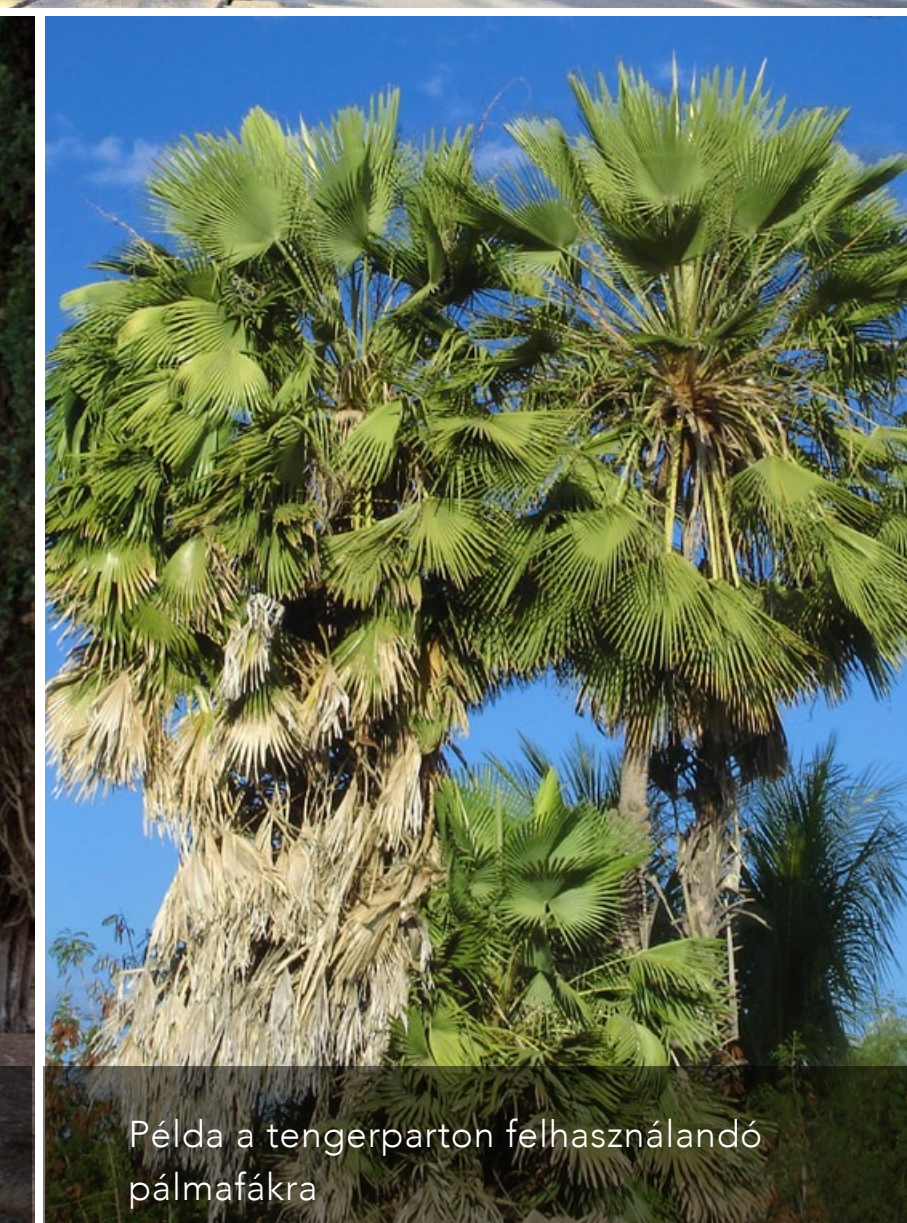
Példa a tengerparton felhasználandó pálmáfkra