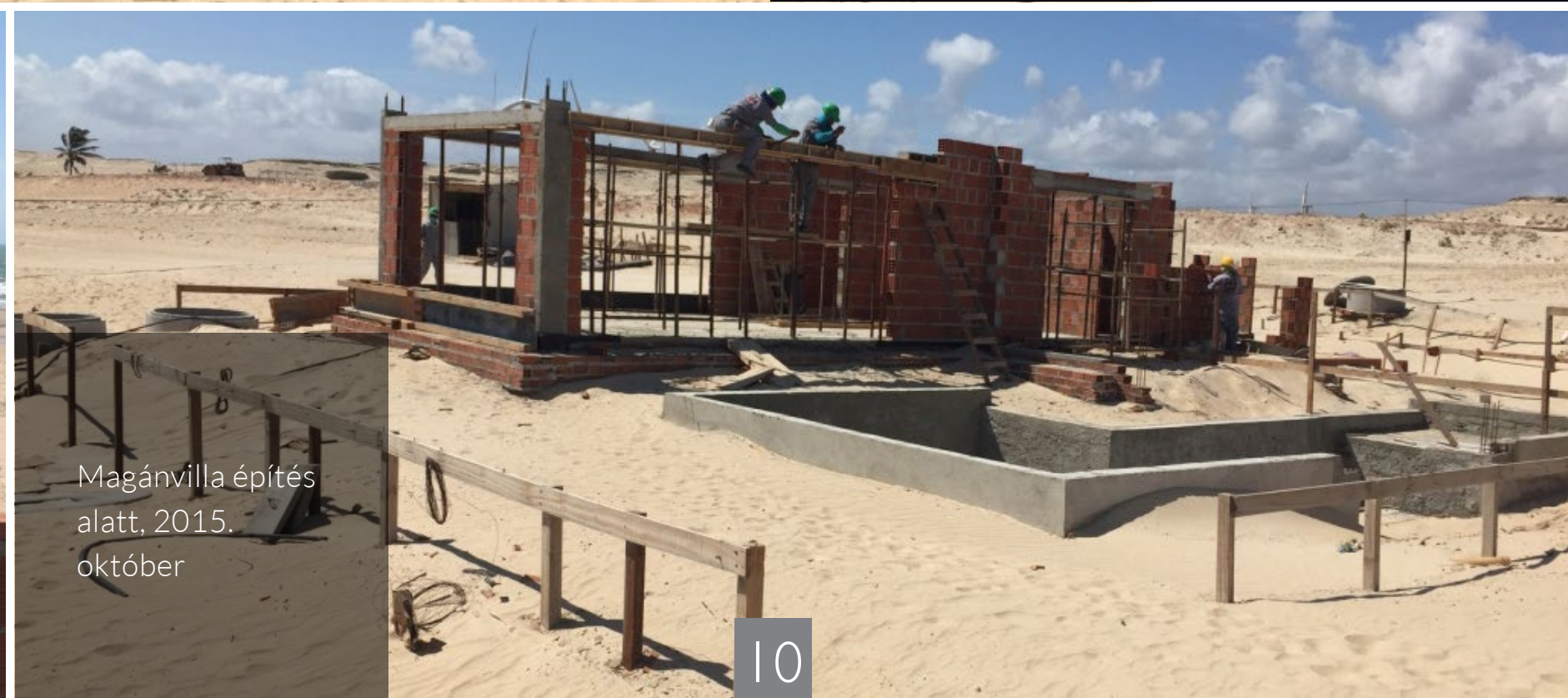
Magánvilla építés alatt, 2015. október