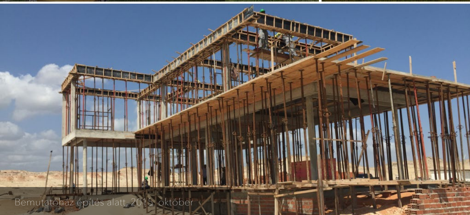
Bemutatóház építés alatt, 2015. október