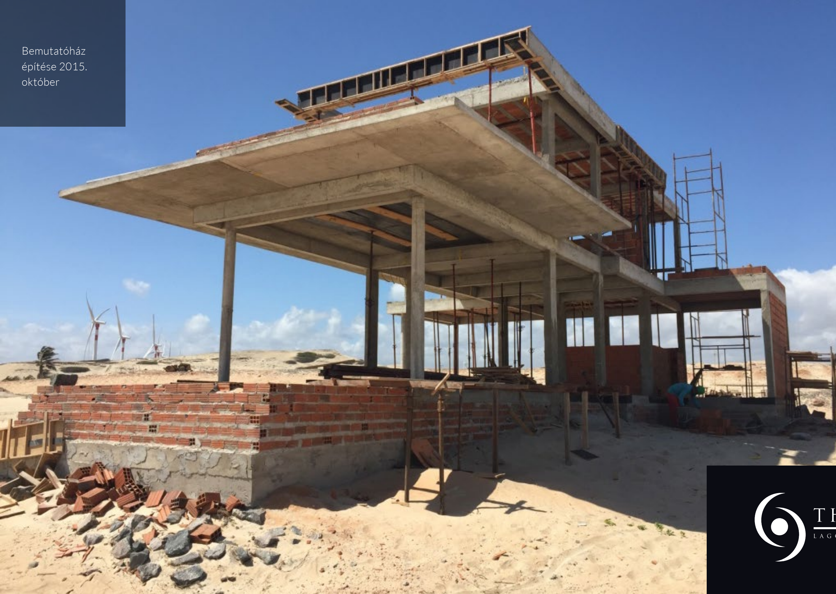
Bemutatóház építése 2015. október