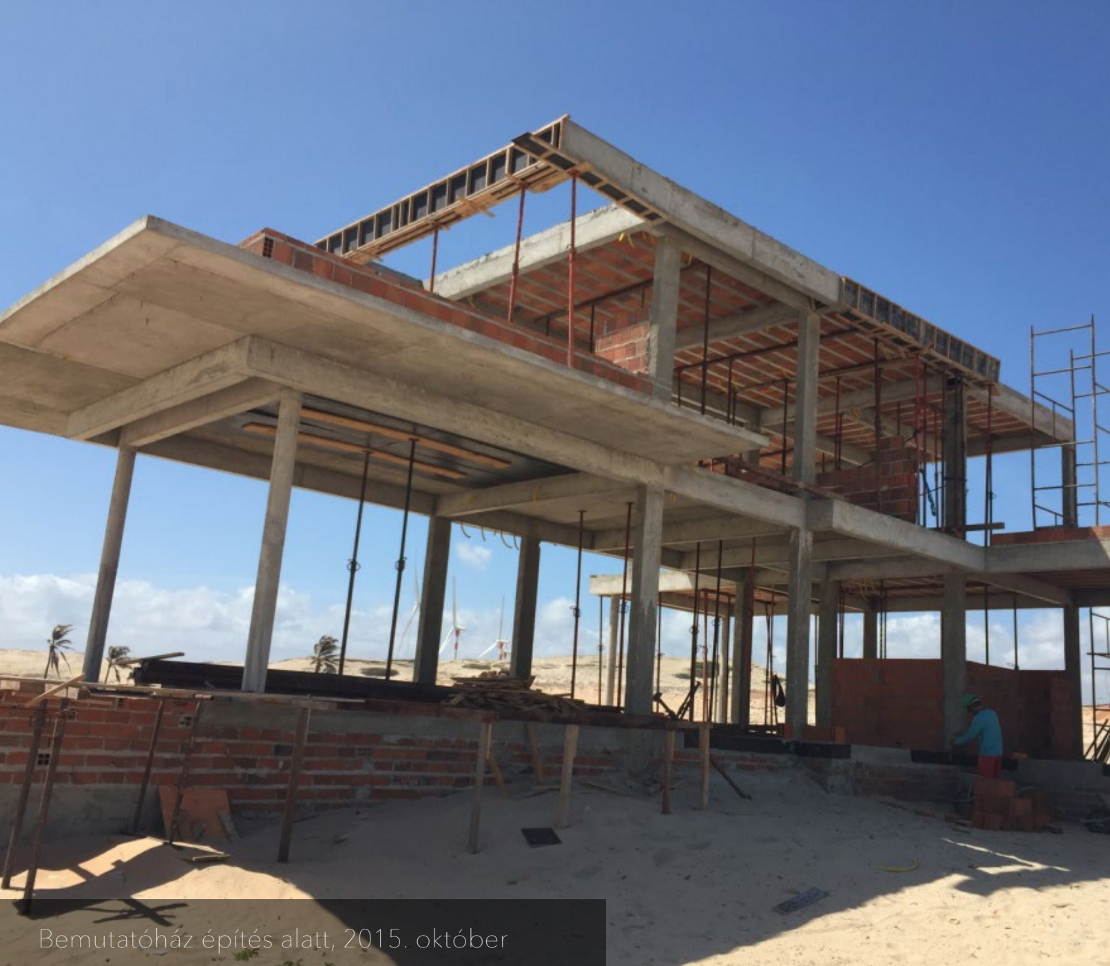
Bemutatóház építés alatt, 2015. október