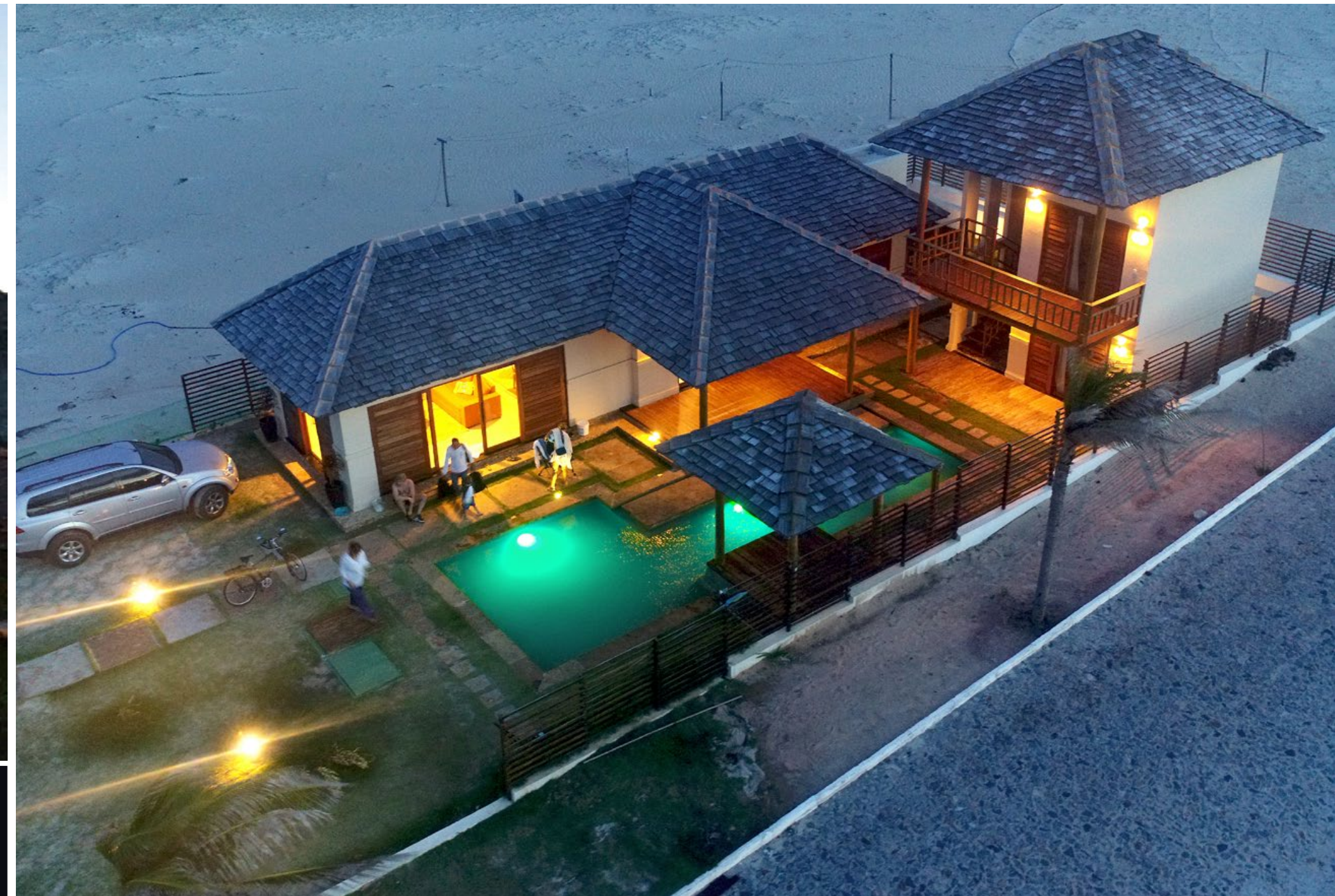
VILLA SUMATERA, QUADRA 4