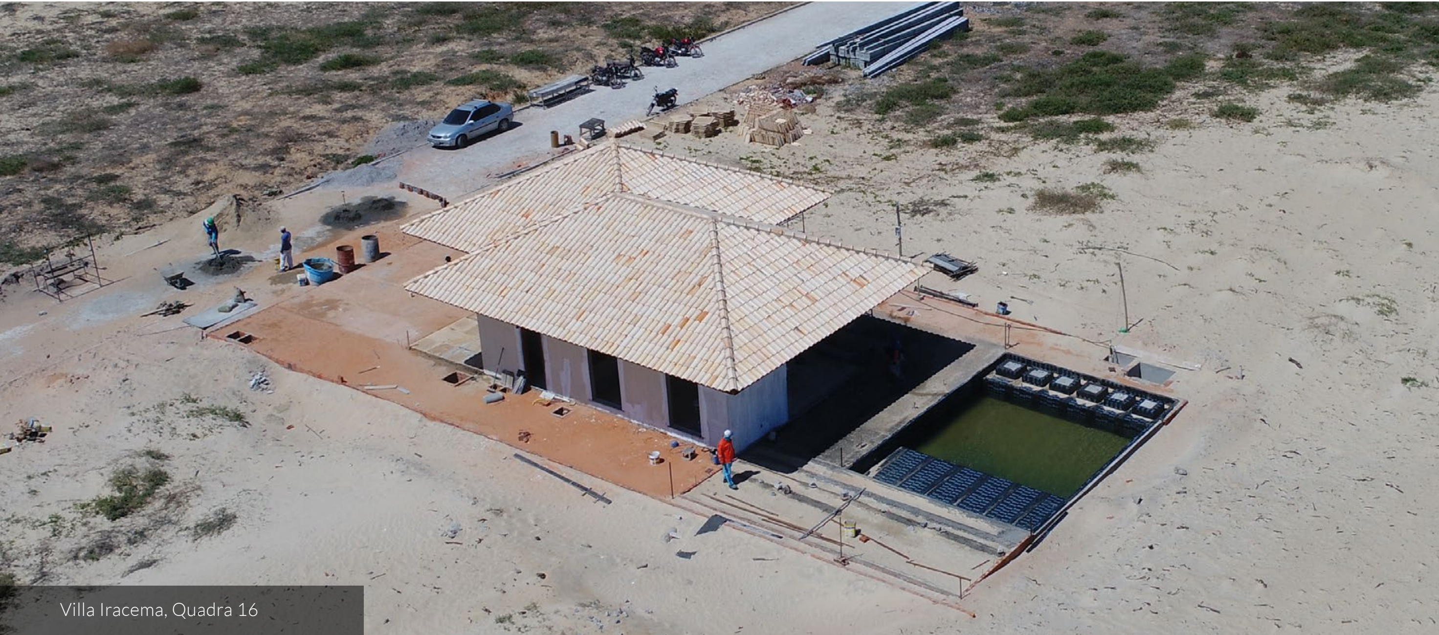
Villa Iracema, Quadra 16