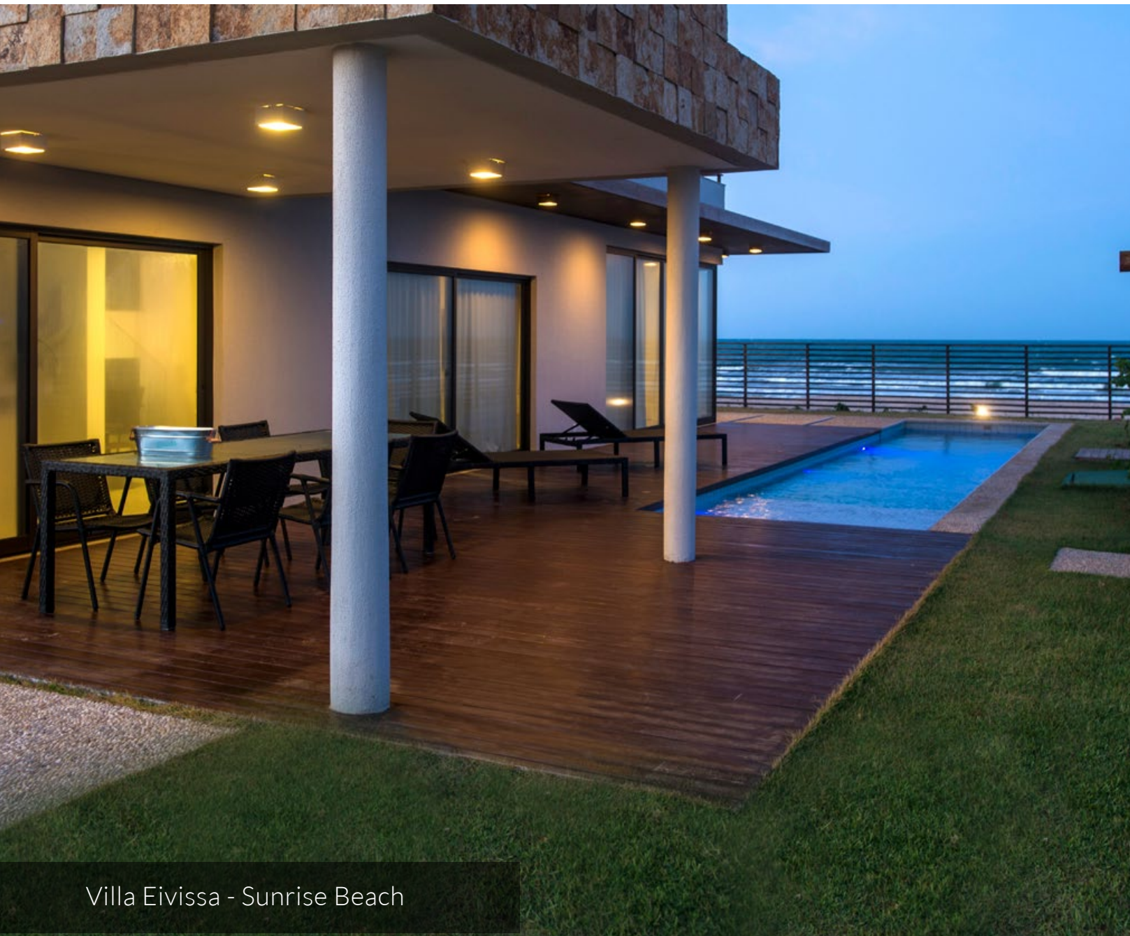
Villa Eivissa - Sunrise Beach