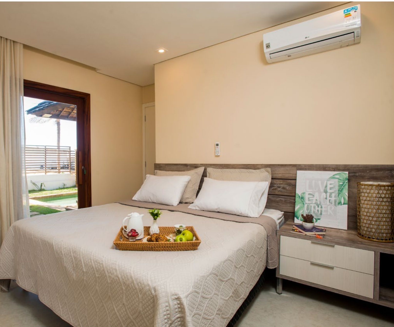
Villa Sumatera - Sunrise Beach