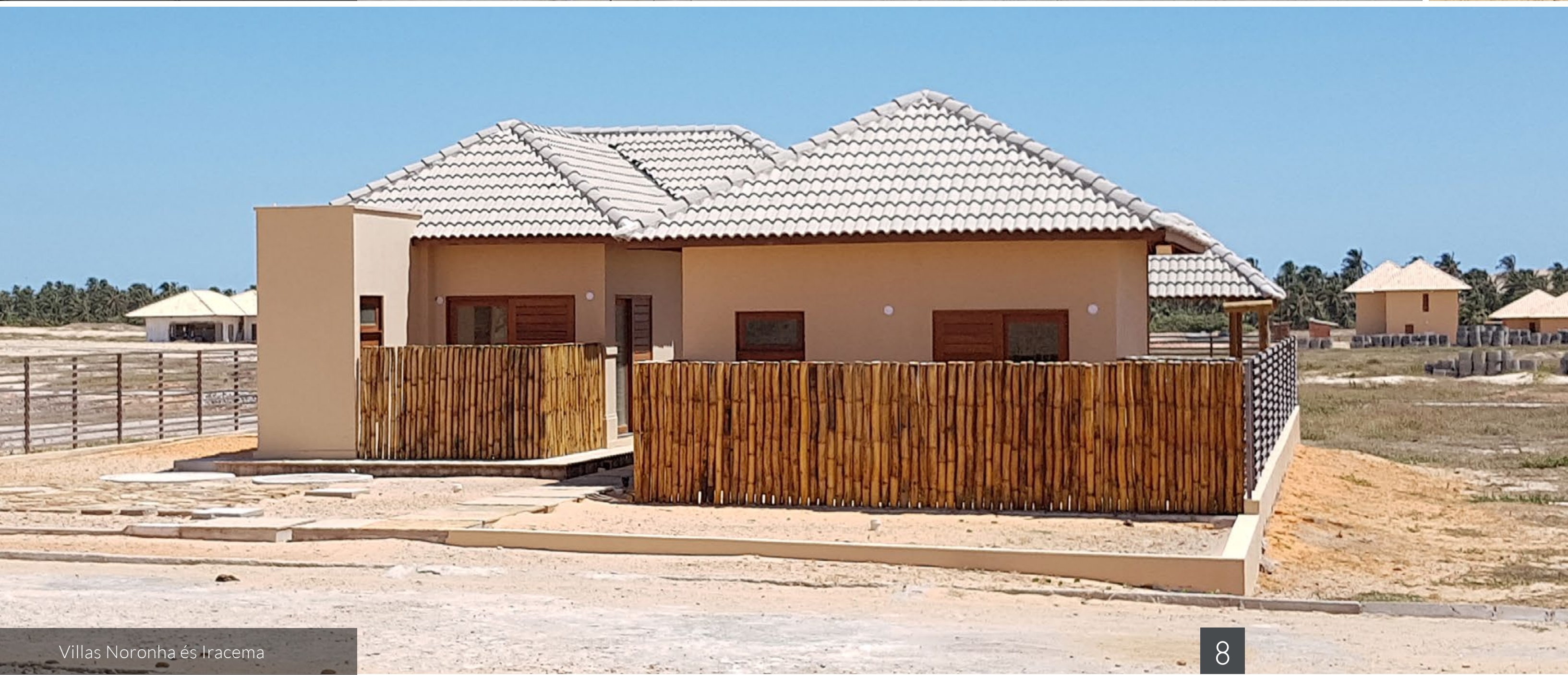
Villas Noronha és Iracema