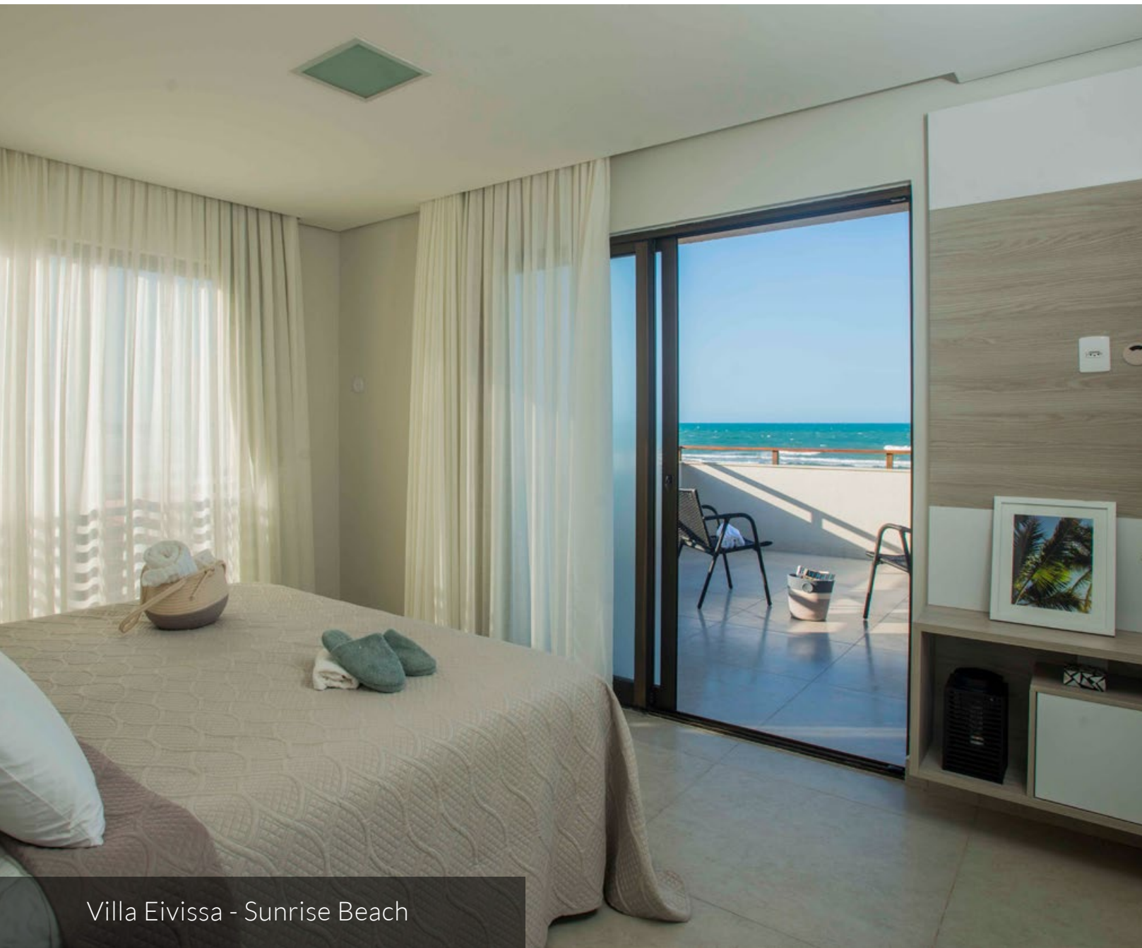
Villa Eivissa - Sunrise Beach