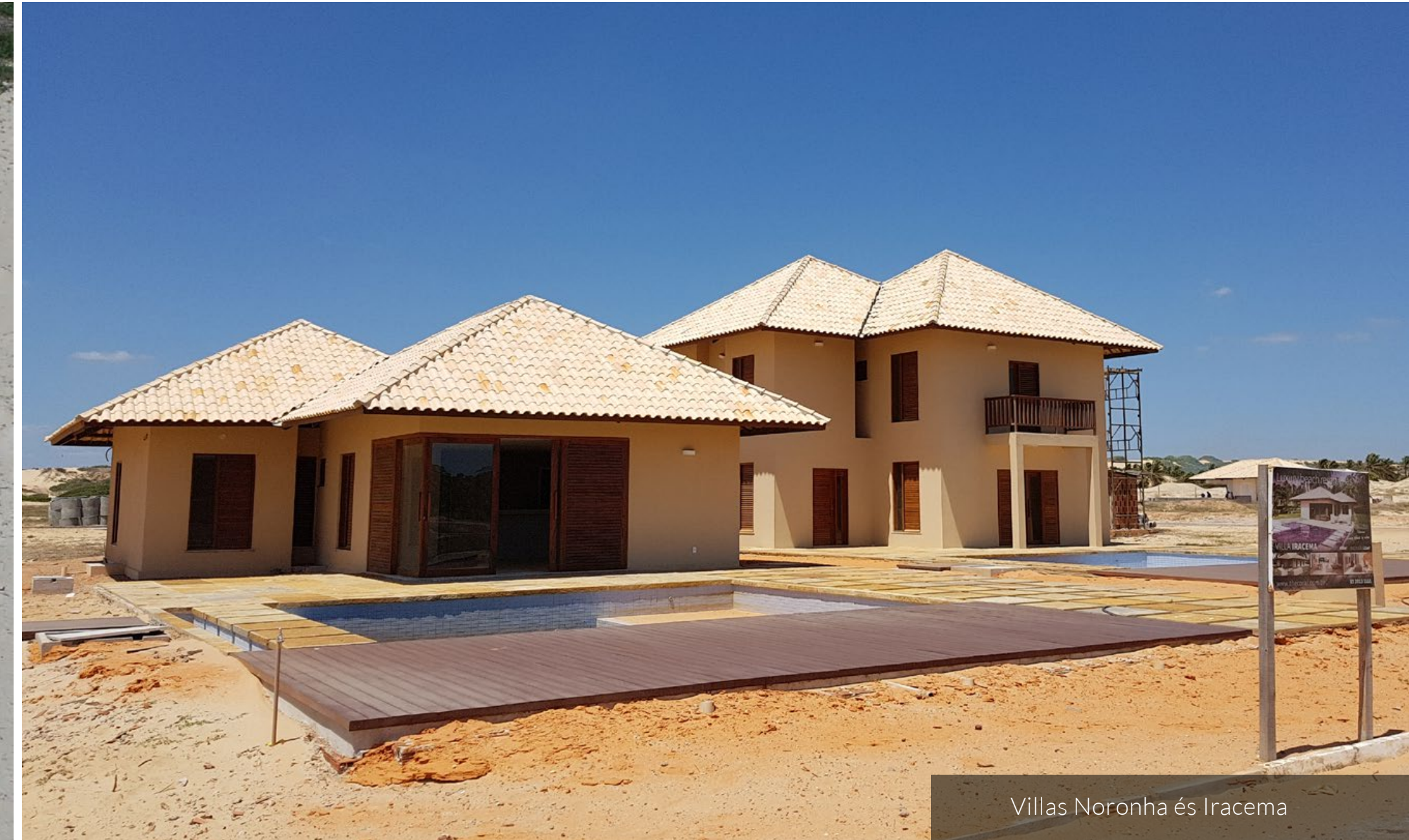
Villas Noronha és Iracema