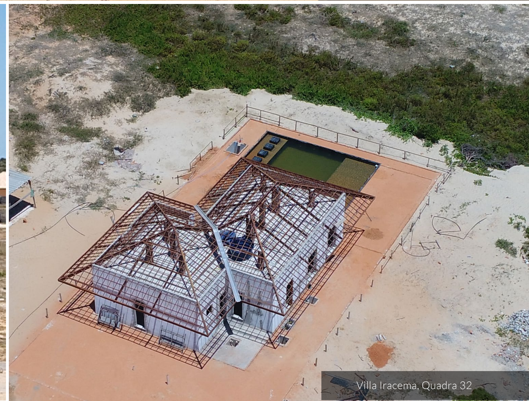
Villa Iracema, Quadra 32